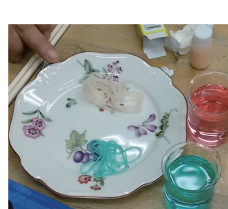
かき氷シロップのイチゴとブルーハワイ。イチゴは紫芋などの天然色素、ブルーハワイは合成着色料です。白い毛糸を染めてみると、合成着色料はしっかり染まり水洗いしてもほとんど落ちませんでした。

(現在、生活クラブ生協は、使用してもよい食品添加物を85品目と定めています。しかし、「使用してはいけない食品添加物」を決めている企業やその他の生活協同組合では、新たに許可されたものは、自主基準での安全性を確認する前に「使用可能な添加物」となってしまうため、購入の際には注意が必要です。)