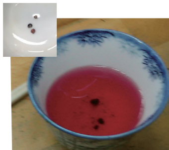
昆虫由来の着色料クチニール。水を入れると赤くなりました。お菓子や、漬物、かまぼこなどに使われています。原料由来のたんぱく質がアレルギーの原因になることがあります。